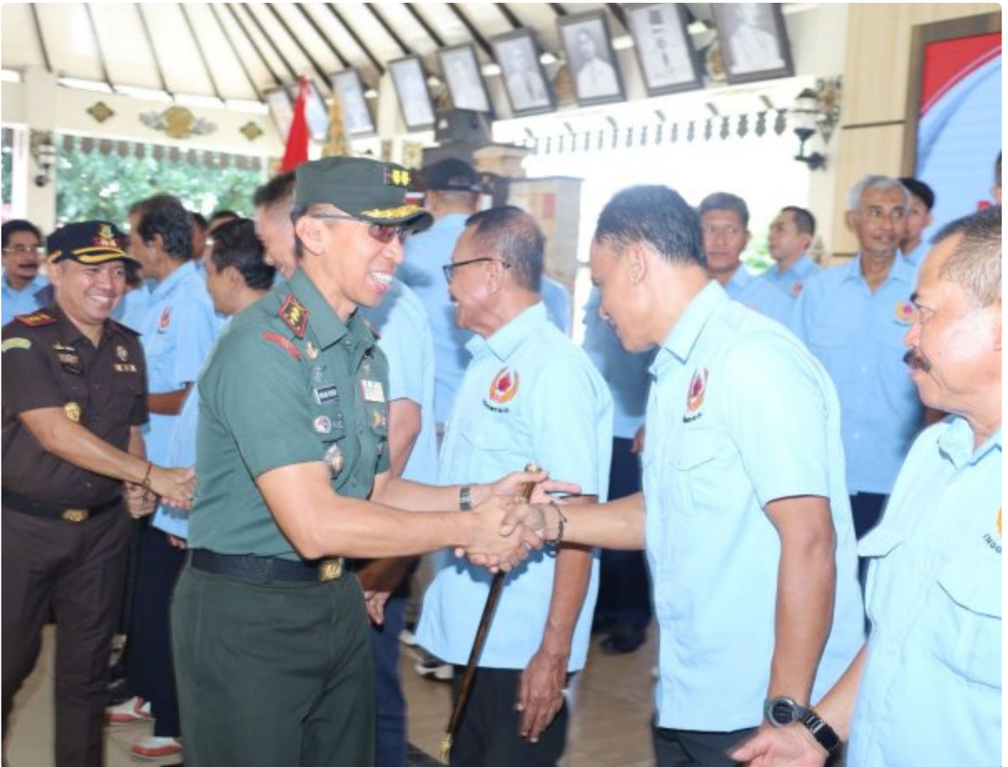
Dandim 0804/Magetan Hadiri Pelantikan Dan Pengukuhan Pengurus KONI Magetan Masa Bakti 2024-2028

Magetan, – Bersama jajaran Forum Komunikasi Pimpinan Daerah (Forkopimda),