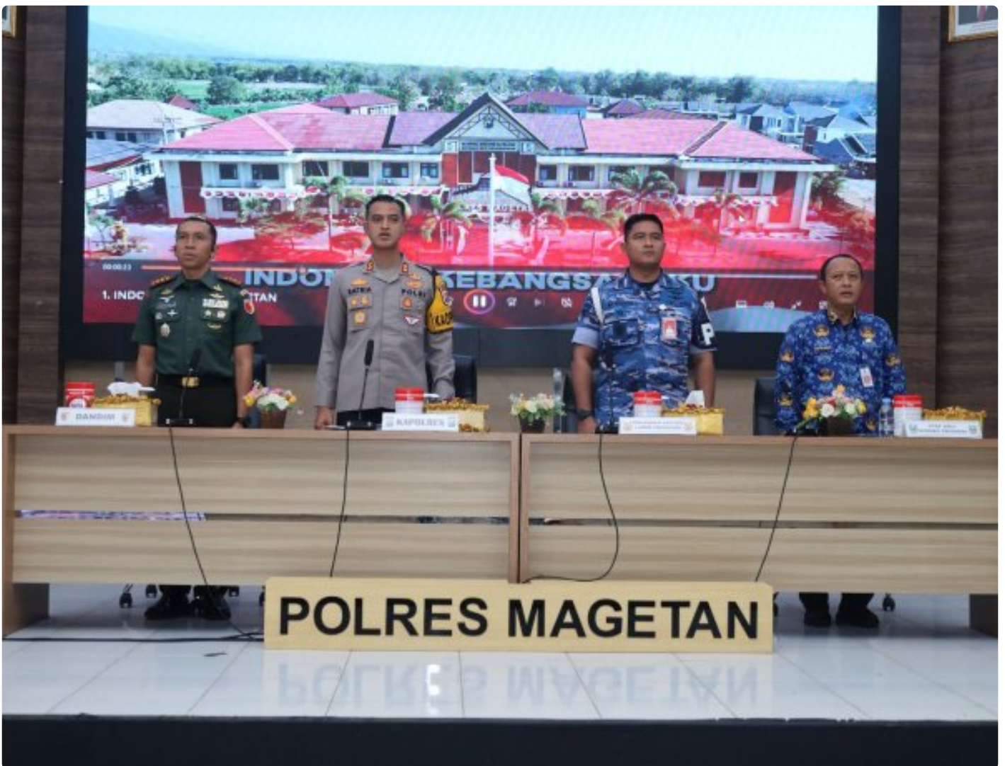
Dandim 0804/Magetan Hadiri Rakor Lintas Sektoral kesiapan operasi lilin 2024

Magetan. – Guna meningkatkan Sinergitas dalam rangka kesiapan operasi lilin 2024 pengamanan Hari Raya Natal 2024 dan Tahun Baru 2025 di wilayah Kabupaten Magetan yang aman dan kondusif.