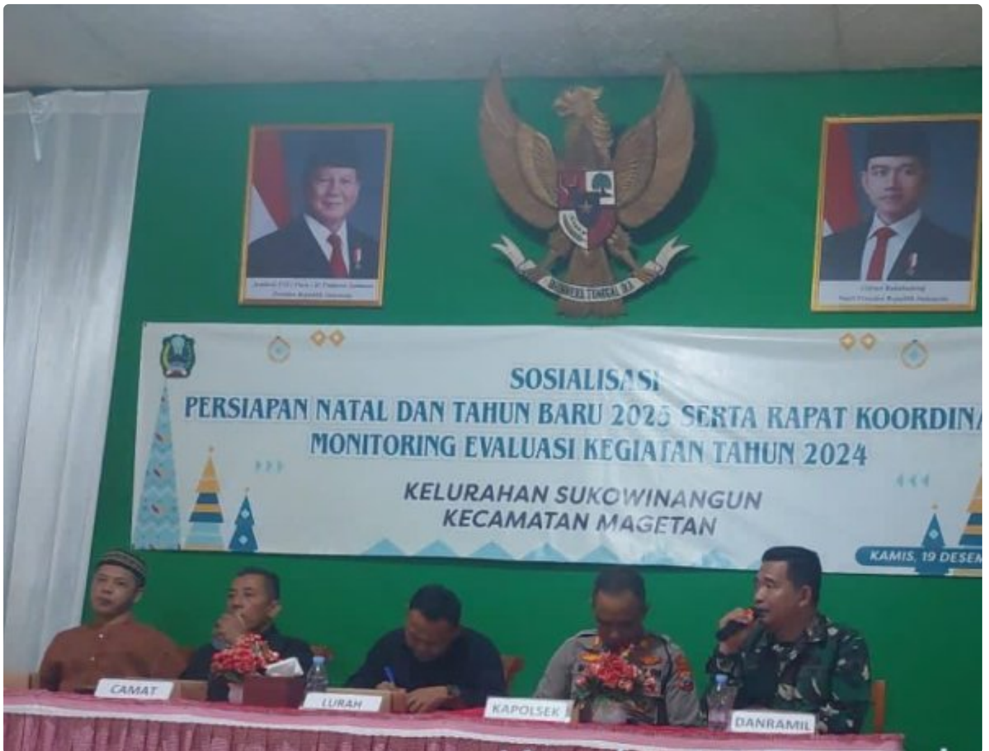
Danramil 0804/01 Magetan Bersama Forkopimca Hadiri Sosialisasi dan Persiapan Natal dan Tahun Baru 2025

Magetan. - Komandan Koramil Tipe B 0804/01 Magetan jajaran Kodim